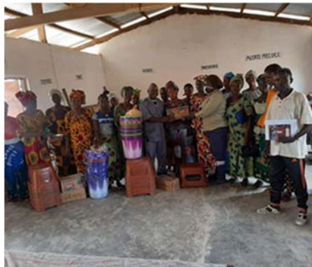
Remise de kits à N'zoo