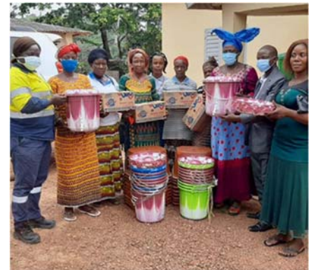
Remise de kits à Bossou