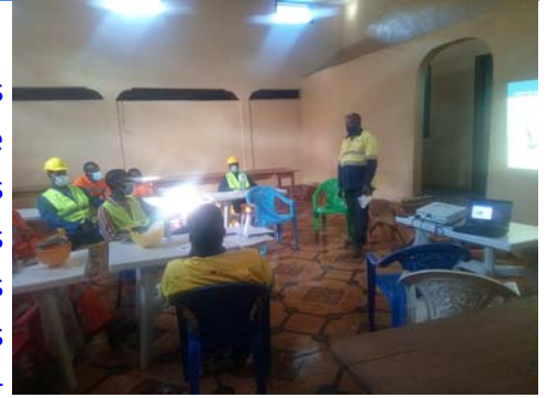
Induction socio Culturelle

Dans le cadre du maintien des relations de bon voisinage avec les communautés, la SMFG a mis en place un guide de bonne conduite appelé induction socio-culturelle pour expliquer à tous ces employés et contractants les conduites à tenir ou non dans les communautés pour éviter tout comportement qui pourrait entraver les coutumes et mœurs de nos communautés. Ainsi, le département des relations communautaires et extérieures en charge de cette induction a expliqué au personnel de l'AGTS en charge de l'étude géotechnique la conduite à tenir, mais aussi les voies de recours en cas d'incompréhension avec un membre de la communauté.