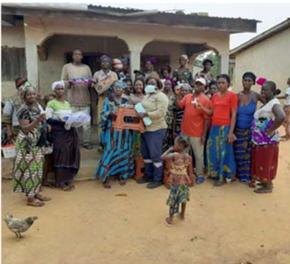
Remise de kits à Gbakoré

Les femmes présentes ont pris l'engagement d'utiliser les kits reçus à bon échéant pour le bien être de leurs associations.