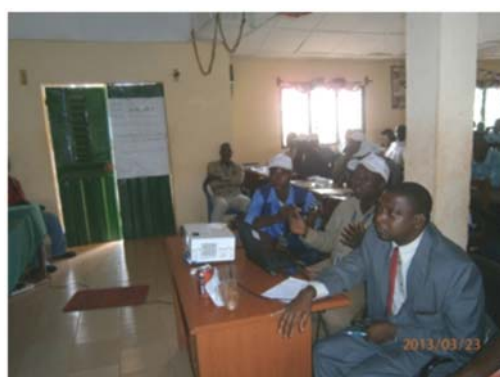
Presentation Power-point de la SMFG lors de la foire organisee par le projet Faisons ensemble a N'Zerekore