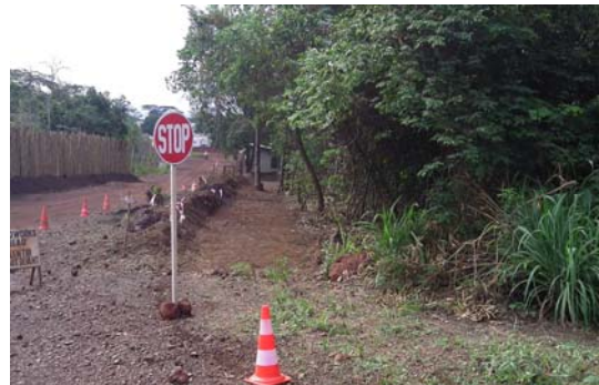
Construction of a new pathway above Cite 1