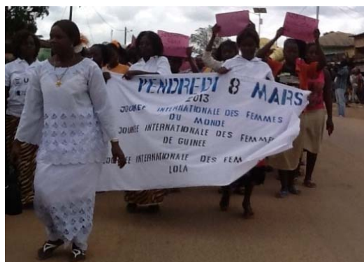
Caravane des femmes de la commune urbaine de Lola lors de la celebration de la fete internationale des femmes 8 Mars 2013