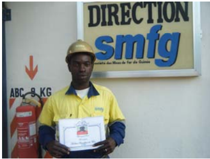
Wanapou Dore de Servicios