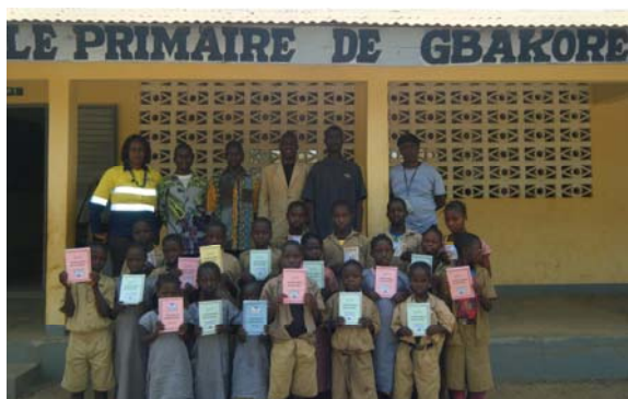
Distribution de cadeaux de livres aux laureats de l'ecole primaire de Gbakore