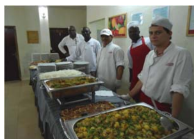
Restaurant d'ADEN Services

Le Département d'administration annonce la prolongation de contrat de services d'Aden jusqu'au 30.Juin 2013