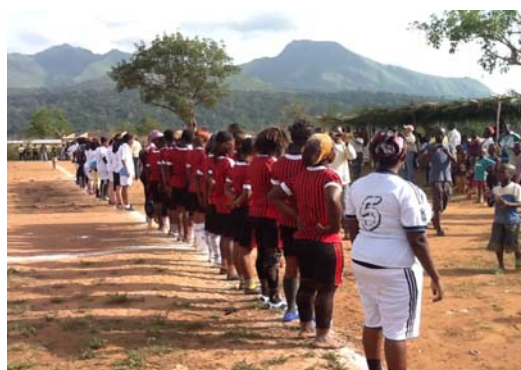
Les equipes de football face a la loge officielle lors de la fete des femmes a Gbakore