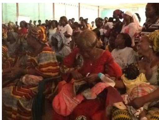
La conference des femmes dans la Commune urbaine de Lola lors la journee du 8 Mars 2013