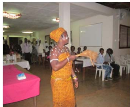
Défilé de la Guinée forestière lors du 8 mars 2013