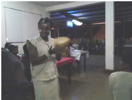
Défilé de la base Guinée lors du 8 mars 2013 a Nimba