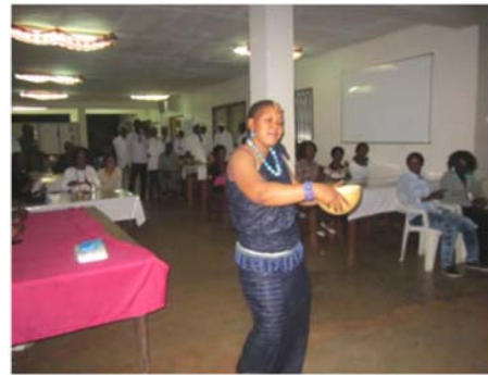
Défilé du Fouta lors du 8 mars 2013 a Nimba