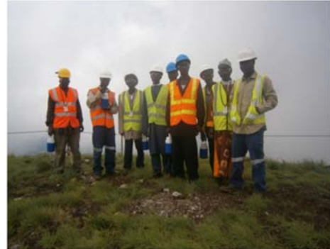
Les sages de Gbakore visite la montagne de Nimba