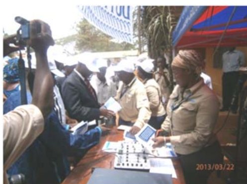
Ditribution des dépliants au stand de la SMFG lors de la foire regionale sur la Gouvernance a N'Zerekore