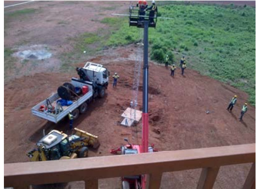
Tower installation at N'Zerekore airport

L'équipe des Travaux Généraux a commencé la construction d'une nouvelle voie cité 1 vers 2, dans le cadre de l'accès sécuritaire aux installations au-dessus du camp principal.