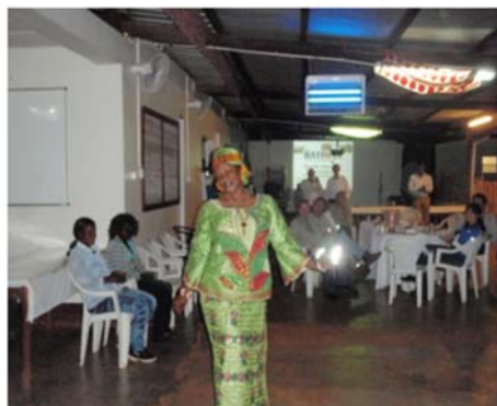
Défilé de la haute Guinée lors du 8 mars 2013 a Nimba