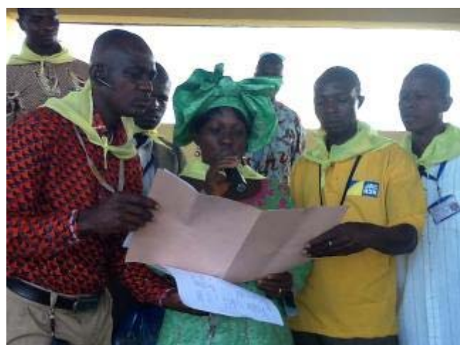
Discours de la Coordination des Jeunes et Femmes de Lola