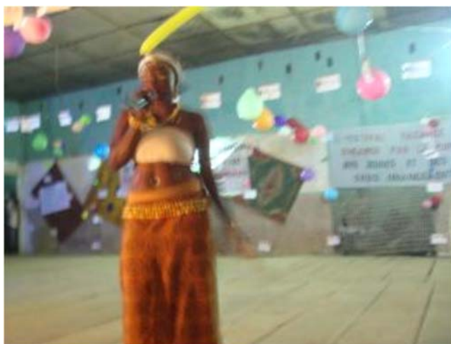
Défilé Miss Lola

Dans le but de renforcer ses liens de bon voisinage avec les populations de Lola, la SMFG a financé un festival vacances sous les auspices des Coordinations des Associations des Jeunes et Femmes pour le Développement et la Paix de Lola (COPIJEPAD). Du 28 août au 20 septembre, dans le cadre des célébrations, une compétition amicale a été organisée entre les jeunes des douze quartiers de la commune urbaine de Lola.