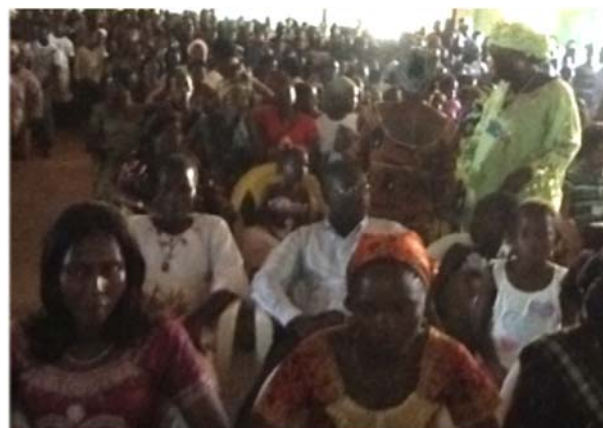
La foule des spectateurs