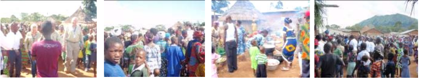
Cérémonie de sacrifice traditionnel à Kéoulenta avec l'équipe des Relations Communautaires