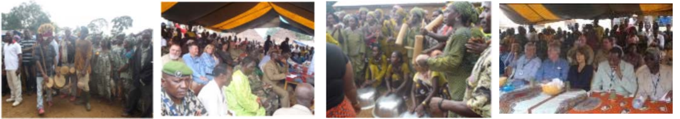
Manifestation de bon voisinage de la communauté de Gbakoré envers la SMFG devant les Ministres