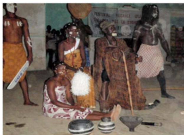
Démonstrations des coutumes culturelles de la localité