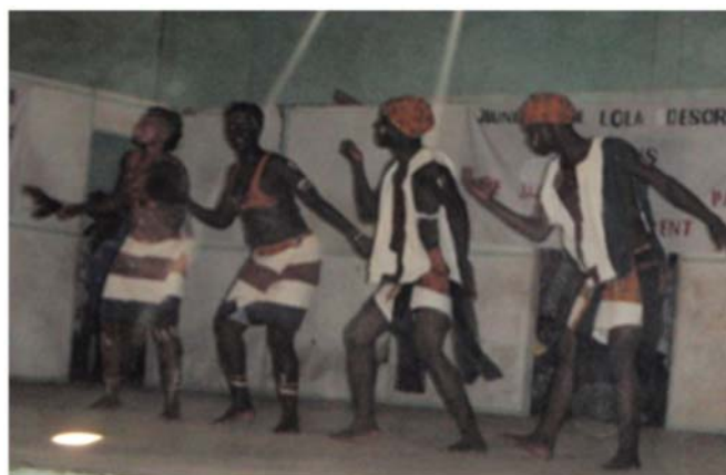
Concours de danses traditionnelles