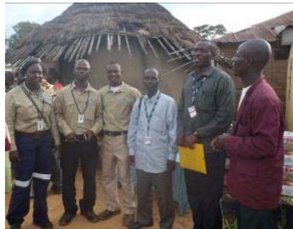
Photos des consultations communautaires tenues en mai/juin 2012