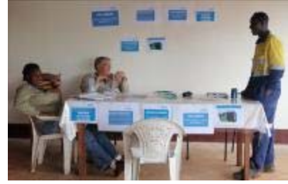
Kiosque d'information : Medium de partage d'information pour les travailleurs de la SMFG