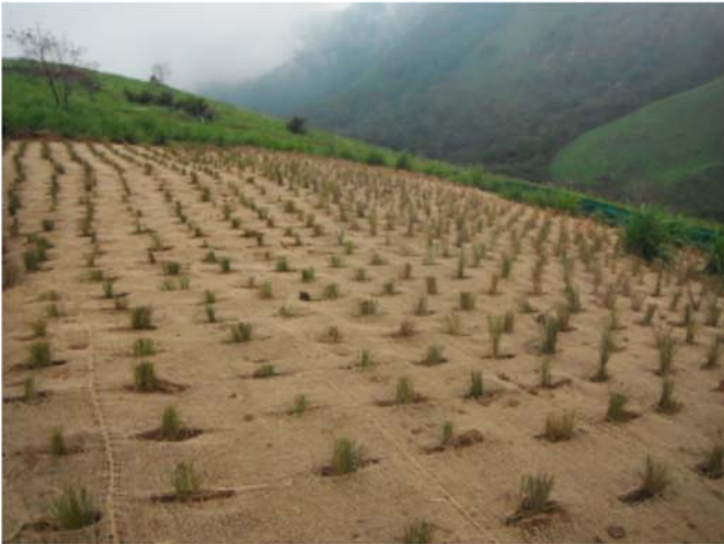
un site de jute netting

Une des principales méthodes de réhabilitation consiste à protéger les sols contre l'érosion, par des outils efficaces tels que le jute netting, le cigar roll, le paillage et la transplantation.