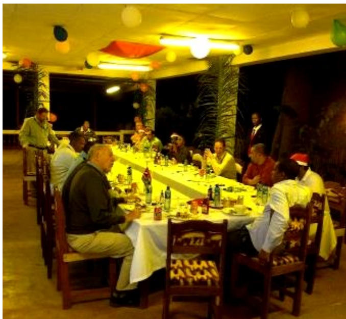
Organisation de Noël 2013