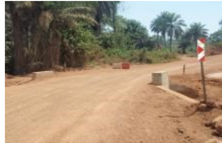
Construction de chaînes de Buses sur la Route Lola-Gogota.

Les travaux d'installation des chaînes de buses sur la route Lola - Gogota se poursuivent.