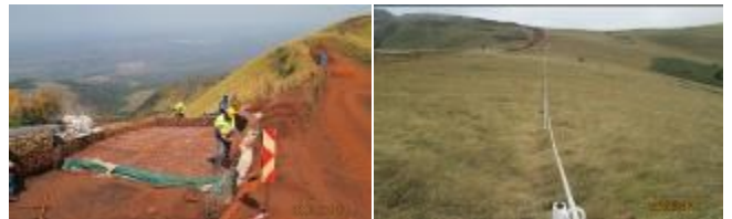
Reconstruction à Bassin 4 et des marqueurs de Limite de concession.

L'équipe de contrôle des sédiments a poursuivi le nettoyage de la structure principale des sédiments au bas du Point Rouge, la reconstruction de la plate-forme d'observation à Château, ainsi que le remplacement des marqueurs de Limite de concession le long du Point Rouge. Des réparations ont été effectuées sur la chaussée le long de la déviation (R002), pour améliorer la stabilité de la surface et la traction pour les véhicules .