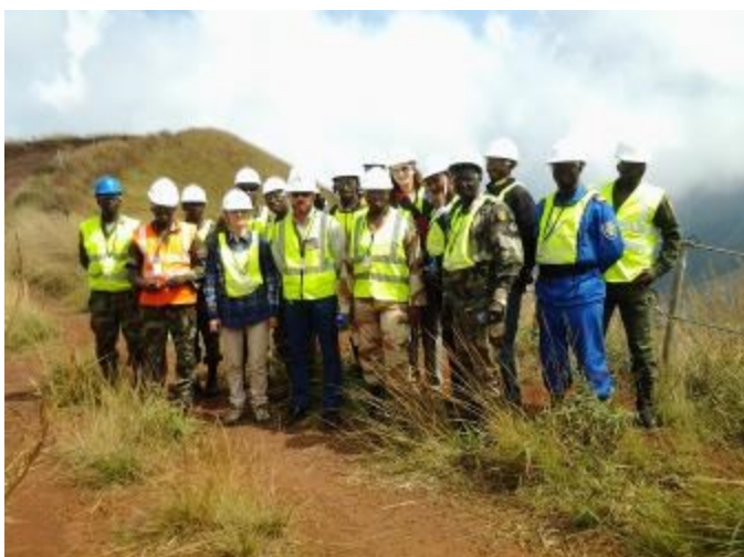
Des prestataires de la sécurité publique en visite sur le site.