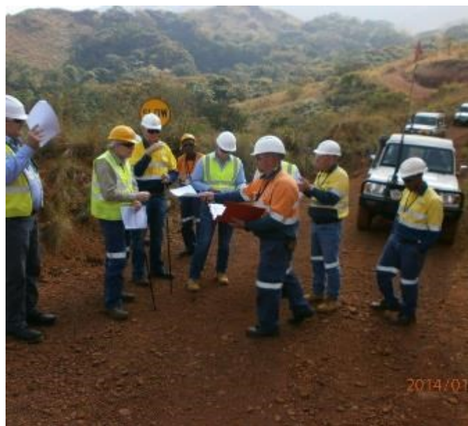
Des représentants des bailleurs evaluent la sécurité sur la montagne