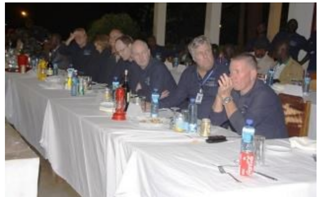
Célébration de la journée Zéro dommage et zéro blessure enregistré (TRIFR) en 2013.