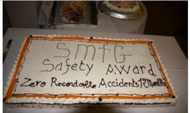
Zéro dommage et zéro blessure enregistré à la SMFG -2013 .

L'objectif de la SMFG est zéro blessure et la réalisation du taux zéro blessure enregistré ( TRIFR ) démontre qu'avec un bon travail d'équipe, l'objectif peut être atteint.