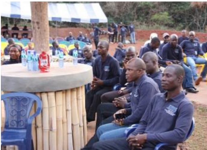
Célébration de la journée Zéro dommage et zéro blessure enregistré (TRIFR) en 2013.