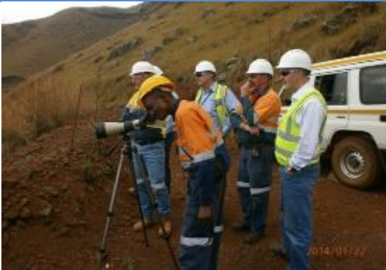
Explication sur les études botaniques aux bailleurs.

L'étude botanique du Mont Nimba se poursuit. 14 des 21 sites ont été achevés, dont 3 ont été atteints en Janvier.