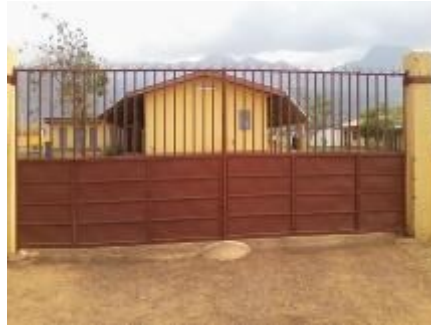
Travaux de peinture réalisés sur la clôture de la cité ouvrière à Gbakoré.

Le Département de la Communauté a joué un rôle essentiel lors des célébrations de la journée zéro accident. Plus de 30 participantes communautaires ont été invitées à participer à cet événement permettant ainsi de fortifier de bonnes relations avec la SMFG.