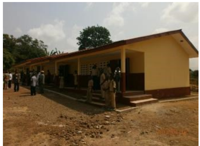
Des salles de classe construites par la SMFG à Bossou