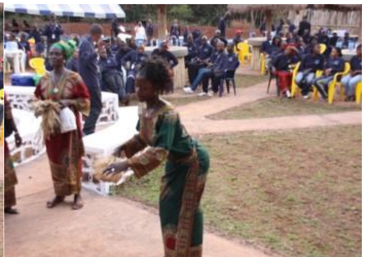
Des pas de dance lors de la célébration de la journée Zéro dommage et zéro blessure enregistré (TRIFR) en 2013.