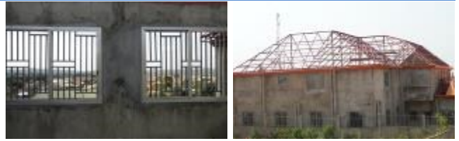
Les travaux réalisés sur les gouttières et fenêtres du bâtiment de Lola.

La construction du bâtiment de la communauté de Lola s'est poursuivie au cours du mois, avec l'installation de gouttières et de fenêtres; la toiture débutera en Février. Une fois que cette opération terminée, la section inférieure du toit sera terminée et mis au point, en vue de l'installation du plafond et des installations internes.