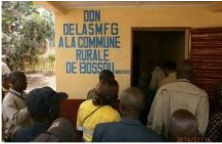
Les Autorités Préfectorales coupent le ruban à la remise officielle des salles de classe construites à Bossou.