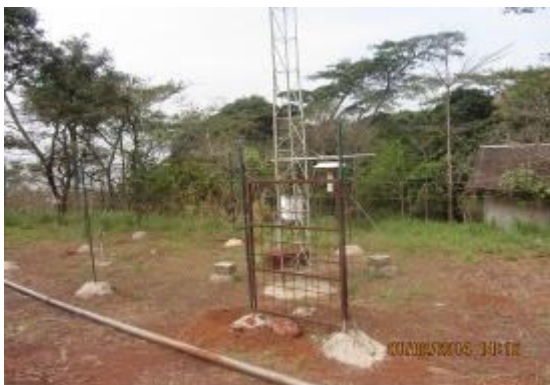
Station météo transféré de la station P2 (camp Gouan) .

La mise à jour de la station météorologique au bureau de la SMFG à Lola est terminée, l'installation devrait avoir lieu avant la fin de Mars. Le réseau de stations météo fournit des informations précieuses sur la biosphère unique de la région.